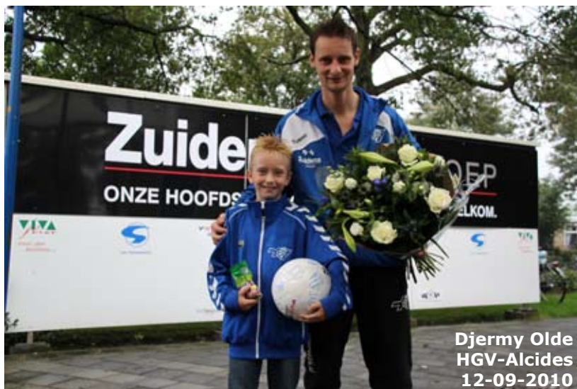
Djermy Olde HGv-Alcides 12-09-2010