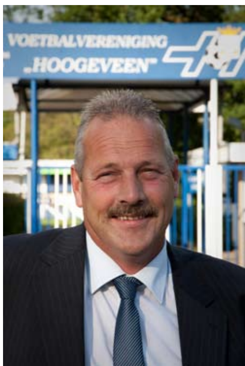
Blauwwitter seizoen 2010-2011

De aanstaande ledenvergadering is voor iedereen een uitgelezen kans om een mening te geven of om te stemmen over bepaalde voorstellen. Nu is hier gedurende het hele seizoen de mogelijkheid wel voor, want een afspraak met het bestuur is gauw gemaakt. Het afgelopen seizoen is hier in tegenstelling tot voorgaande jaren enige malen gebruik van gemaakt, iets wat het bestuur alleen maar toejuicht. Voor ons als bestuur is deze vergadering een jaarlijkse graadmeter hoe het huidige beleid wordt ontvangen en wat de visie van onze leden is en welke koers de vereniging wil varen. Met name de laatste zin is op de komende vergadering aan de orde. Nu de periode van 5 jaar toekomstvisie er op zit zullen we voor de komende jaren weer een nieuwe visie moeten vaststellen. Als voorzitter ben ik ervan overtuigd dat de samenleving zich niet aanpast aan de vereniging, maar dat de vereniging zich zal moeten aanpassen naar de vraag vanuit diezelfde samenleving. Gezien het feit dat onze statuten behoorlijk verouderd zijn zullen we hier eens grondig naar moeten kijken. Als we alleen al kijken naar de afgelopen 5 jaar dan is er in die tijd veel veranderd. Met name de toetreding tot de hoofdklasse zorgt voor veel extra regels en richtlijnen die voorheen totaal onbekend waren. Arbo-wetgeving hadden we als voetbalvereniging nog nooit van gehoord, maar is nu ook op ons van toepassing. En zo zijn er veel meer regels die we moeten uitvoeren, als