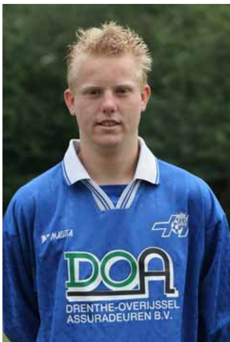
Blauwwitter seizoen 2007-2008