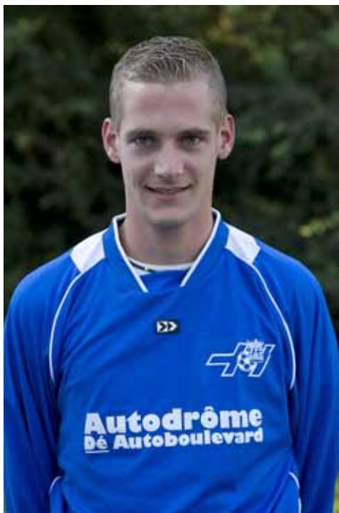
Blauwwitter seizoen 2008-2009