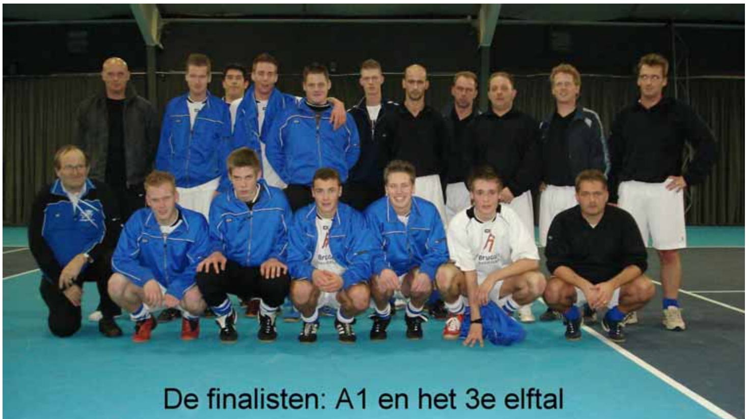
De finalisten: A1 en het 3e elftal